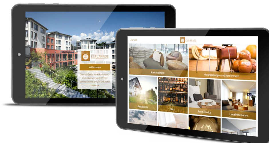
Die SuitePad Installation vom Hotel Esplanade Bad Saarow.

Seit Februar 2016 sind alle Zimmer im Esplanade Resort & Spa Bad Saarow mit SuitePads ausgestattet. Hierbei handelt es sich um Tablets, welche den Hotelgästen während des gesamten Aufenthalts als digitale Gästemappe auf den Zimmern zur Verfügung stehen. Die dazugehörige Software wird ebenfalls von der Firma SuitePad gestellt.